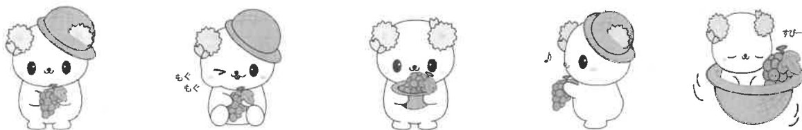
伊台のマスコットキャラクター「いだっぴい」

市内各地区の民生児童委員協議会会長の挨拶(伊台地区会長も掲載)や、五明・伊台・湯山地区の地域ケア圏域会議が記事として取り上げられています。