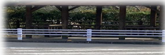
ガードパイプ新設(JA交差点前)