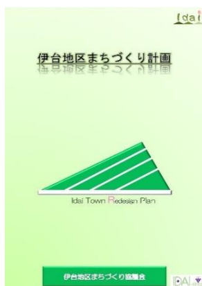
伊台地区まちづくり計画